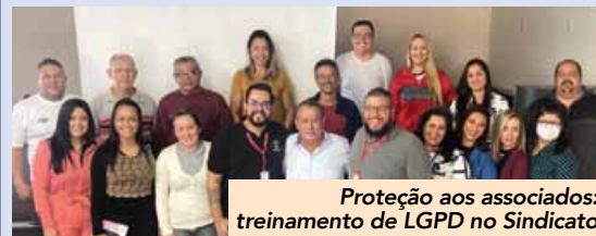
Proteção aos associados: treinamento de LGPD no Sindicato