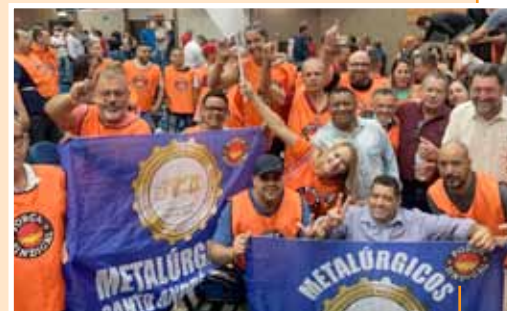
Metalúrgicos de Santo André e Mauá, com bandeiras do Sindicato no ato de apoio do Solidariedade com Lula

Neste final de semana, no sábado (07), o Partido dos Trabalhadores oficializou a pré-candidatura da chapa Lula-Alckmin à presidência da república. Além da participação dos partidos apoiadores, sindicatos e representantes de movimentos marcaram presença. O ex-governador, candidato a vice na chapa de Lula, disse no lançamento do Movimento Juntos Pelo Brasil. "Lula não é a 1ª, nem a 2ª, nem 3ª, é a única via da esperança para o Brasil".