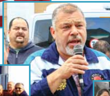
Assembleia também teve ação de sindicalização com assessoras