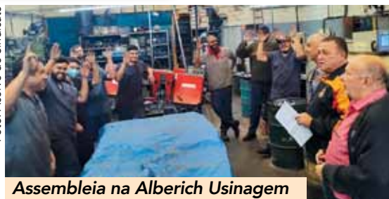
Assembleia na Alberich Usinagem