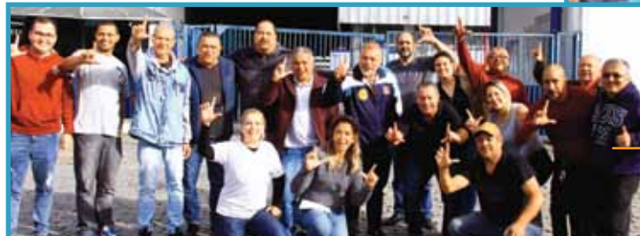
Sindicato marca presença com diretoria e assessores