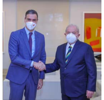
Enquanto Bolsonaro faz passeio com a família no Oriente Médio, Lula recebe tratamento de estadista em agenda de liderança política