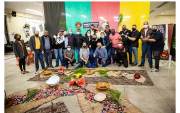
Exposição celebra a Consciência Negra na sede do Sindicato dos Metalúrgicos de Santo André e Mauá