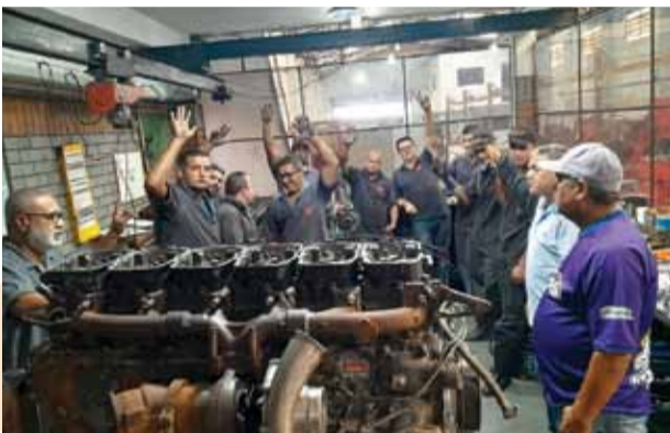
Em assembleia, trabalhadores aprovam acordo de PLR

Os trabalhadores na Retífica Andreense aprovaram em assembleia realizada na sexta-feira, 31 de março, a proposta de PLR (Participação nos Lucros e Resultados) que será paga em parcela única agenda para o dia 30 de julho de 2023.