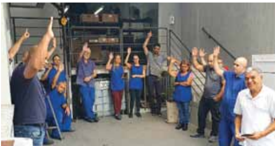
Proposta de PLR é aprovada

Durante assembleia realizada na tarde da segunda-feira, 27 de março, os trabalhadores e trabalhadoras na Sperone, em Santo André, levantaram os braços em aprovação da PLR (Participação de Lucros e Resultados) negociada pelo Sindicato com a empresa.