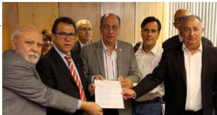
Lideranças sindicais entregam documento ao ministro Marinho

Na segunda-feira, 03 de abril, as centrais sindicais propuseram ao governo uma proposta para política pública de longo prazo, de 25 anos, para valorização do salário mínimo. Isto significa, não só para o atual governo, mas até 2053. Com reajuste pelo INPC, aumento real equivalente ao PIB mais um "pisão" e revisão da aplicação das medidas