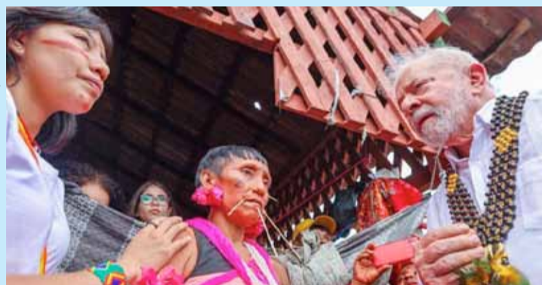
"Mais que uma crise humanitária, o que vi em Roraima foi um genocídio", disse Lula em socorro ao povo Yanomami, uma das ações que marcaram os 100 dias.

A volta e o fortalecimento de programas sociais e essenciais ao povo brasileiro como Bolsa Família, Minha Casa Minha Vida, Farmácia Popular, Programa Nacional de Alimentação Escolar, além de ações focadas na retomada do crescimento econômico a exemplo da política de reajuste real do salário mínimo, entre outras medidas que ainda precisam de um tempo para surtirem efeito no dia a dia da sociedade, marcaram os 100 dias do terceiro mandato de Lula.