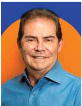
Paulinho da Força Presidente do Solidariedade

já estamos ganhando de 2 a 0, neste pedido, em que tanto lutamos, por uma nova correção para o FGTS, já sendo aceita por dois ministros. Temos certeza que os demais ministros vão seguir os votos do Barroso e do Mendonça. Vamos repor essa grande perda que os trabalhadores tiveram”, comemorou Paulinho.