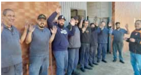
Metalúrgicos em votação na aprovação de PLR