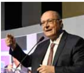
Alckmin diz que governo vai anunciar medidas para fomentar setor automotivo

As ações devem incluir a redução da carga tributária para incentivar a venda de carros populares. Aliás, o retorno ao mercado brasileiro do chamado carro popular entrou na agenda do governo e, nos últimos dias, tem sido citado pelo presidente Luiz Inácio Lula da Silva. Para montadoras e concessionários, o assunto é visto num cenário de urgência com a queda de vendas, fábricas suspendendo a produção e sindicatos de trabalhadores temendo demissões.