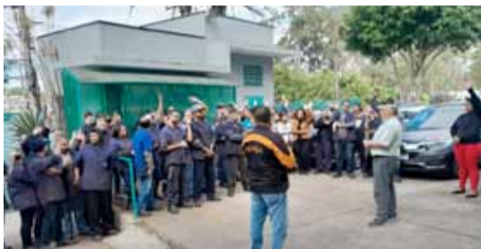
Companheirada em assembleia na MIC