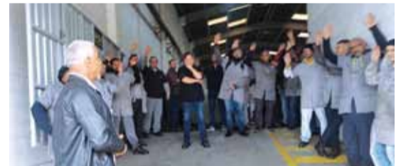
Trabalhadores em assembleia optam por troca de feriado