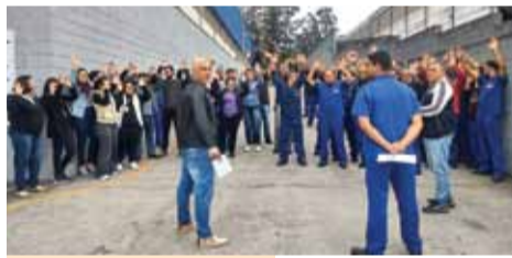
Metalúrgicos em assembleia de PLR