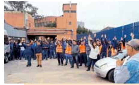
Na Benteler, companheiros e companheiras aprovam PLR

Os companheiros e companheiras na Benteler aprovaram na terça-feira, 30 de maio, em assembleia, o acordo negociado de PLR no valor de R$ 4.500,00 que será pago em duas parcelas.