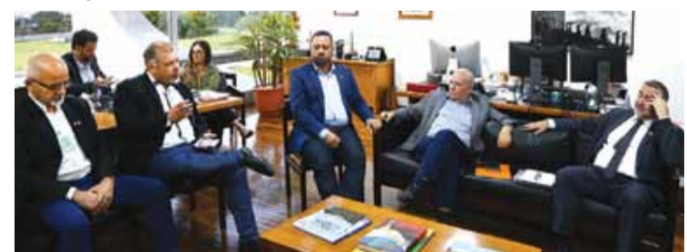
Sapão sugere ações para melhorar a comunicação social e popular do governo Lula

No encontro, o ministro Paulo Pimenta recebeu as agendas Legislativa e Jurídica do movimento sindical, a pauta da Conferência da Classe Trabalhadora (Conclat 2022), além do planejamento desta parceria solidária com a área de comunicação social do governo feito pelos jornalistas da Força Sindical.