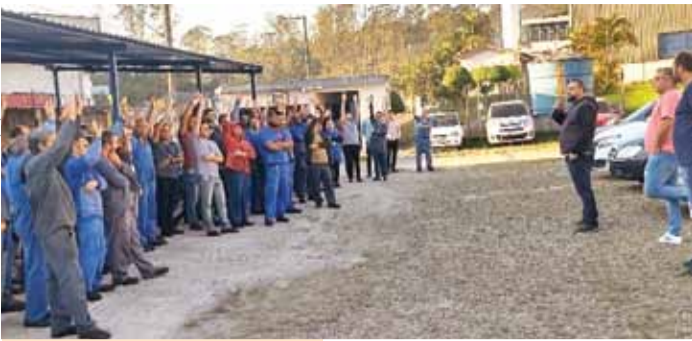
Metalúrgicos durante votação, em assembleia, na Jardim Sistemas

Em assembleia realizada na quarta-feira, 23, os metalúrgicos e metalúrgicas na Jardim Sistemas, em Mauá, aprovaram a proposta de mudança de horário e compensação de dias pontes negociada