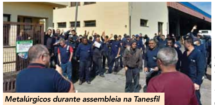
Metalúrgicos durante assembleia na Tanesfil

Os trabalhadores e trabalhadoras na Tanesfil conquistaram uma vitória com o fechamento do acordo de PLR (Participação nos Lucros e Resultados) deste ano, negociado pelo Sindicato e que prevê o pagamento de R$ 1.100,00 em parcela única no dia 31 de dezembro de 2022.