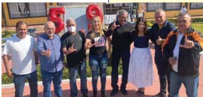
Metalúrgicos de Santo André e Mauá marcam presença no aniversário do Sindicato de Osasco e Região

Uma grande festa de confraternização entre companheiros e companheiras. Assim foi o aniversário de 59 anos do Sindicato dos Metalúrgicos de Osasco e Região, neste sábado, 23 de julho. Com direito ao toque de bola nostálgico do time de Master do Corinthians, com Biro-Biro, Dinei, Wladimir e companhia.