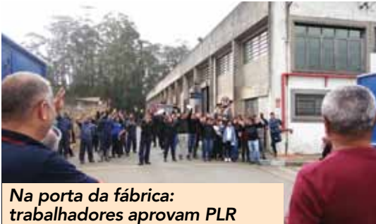
Na porta da fábrica: trabalhadores aprovam PLR

O Sindicato, em ação com a comissão de trabalhadores na MRS, em Mauá, conquistou a PLR (Participação nos Lucros e Resultados) no valor de R$ 1.000,00. A proposta teve aprovação dos metalúrgicos em assembleia, nesta quarta-feira (20) e será paga em duas parcelas, sendo a primeira no dia 29 de julho e a segunda em 31 de janeiro de 2023.