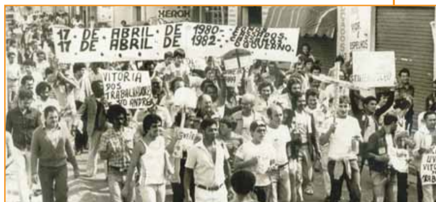
Passeata na rua Gertrudes de Lima pela retomada do Sindicato

ras nas fábricas", afirma. No documentário que faz parte da exposição "Expo Lutas & História", e será exibido no sábado, durante o evento de aniversário, aparece o presidente Lula, na época, no final dos anos 1970, o líder metalúrgico que sacudiu a relação capital e trabalho no Brasil, comenta a representatividade do nosso Sindicato. "O Sindicato de Santo André tem se transformado num sindicato muito importante e ponta de lança das lutas dos trabalhadores deste país", disse Lula.