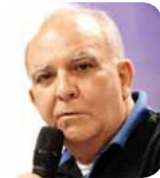
Miguel Torres Presidente da Força Sindical, da CNTM (Confederação Nacional dos Trabalhadores Metalúrgicos) e do Sind. dos Metal. de São Paulo e Mogi das Cruzes

"Um exemplo de Sindicato sólido, representativo e atuante é o Sindicato dos Metalúrgicos de Santo André e Mauá. Sempre nas lutas e conquistas para categoria, mas também forte e presente nas ações da CNTM e da Força Sindical em defesa dos direitos da classe trabalhadora no geral e por uma vida melhor a todo povo brasileiro. Um forte abraço a essa fabulosa entidade pelos seus 90 anos."