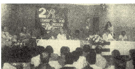
Em 1984, II Congresso dos Metalúrgicos de Santo André e Mauá

O caos não chegou e hoje milhares de brasileiros são beneficiados por esta conquista que teve início no nosso Sindicato.