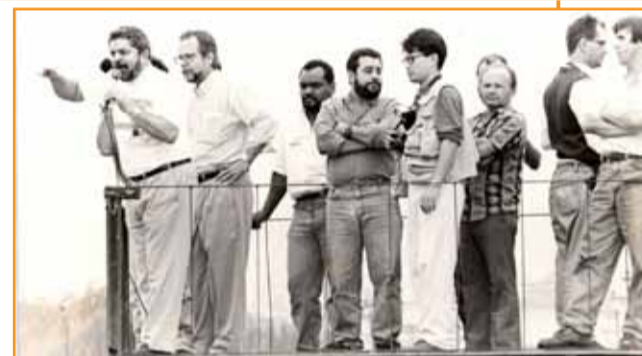
Lula discursa com Martinha e outros companheiros, na Cofap, no final da década de 80