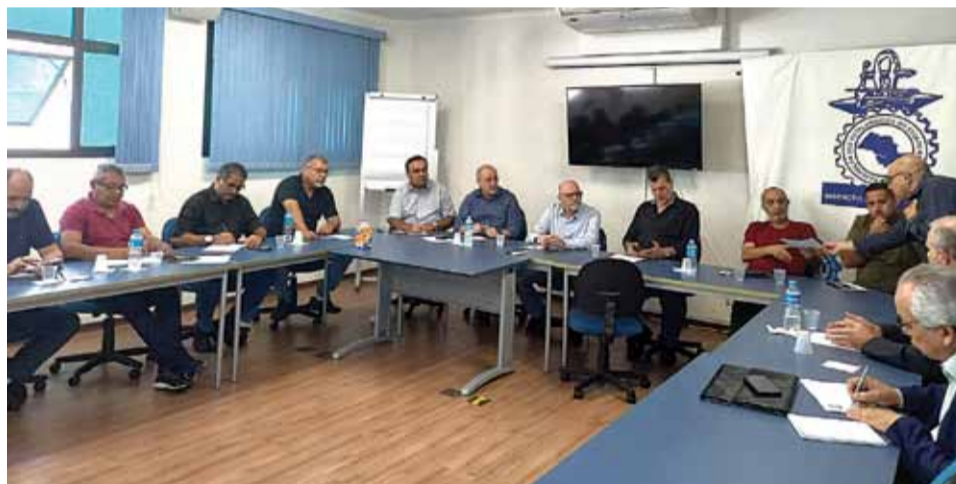
Diretoria do Sindicato participa de reuniões com os grupos Sindipeças, Sindiforja, Sinpa e Fundição