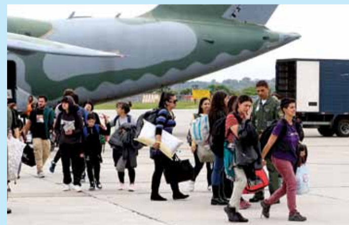
Brasileiros desembarcam no Rio de Janeiro, no sétimo voo da Operação Voltando em Paz

O primeiro voo de repatriação foi realizado no dia 10