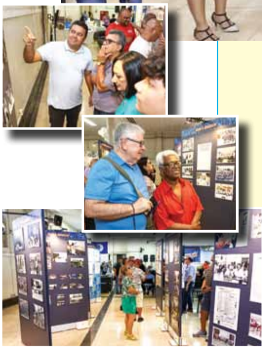
Exposição celebrou história do Sindicato

Um tributo aos companheiros e companheiras que durante anos atuaram na diretoria do Sindicato, contribuindo para o avanço das nossas pautas de lutas e conquistas.