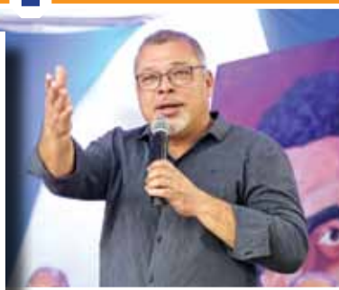
Presidente, Sapão, em discurso de posse