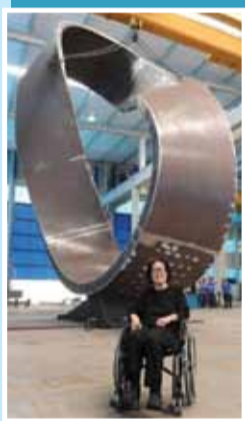
Tomie, acompanhando a construção do monumento

Em 2013, no aniversário de 80 anos de história, o Sindicato homenageou os trabalhadores e trabalhadoras da região do ABC, com um monumento na forma do laço do infinito, feito pela renomada e saudosa artista plástica, Tomie Ohtake, instalado no Paço Municipal de Santo André. Até então, não havia nenhuma obra em espaço público, no ABC, dedicada à classe trabalhadora.