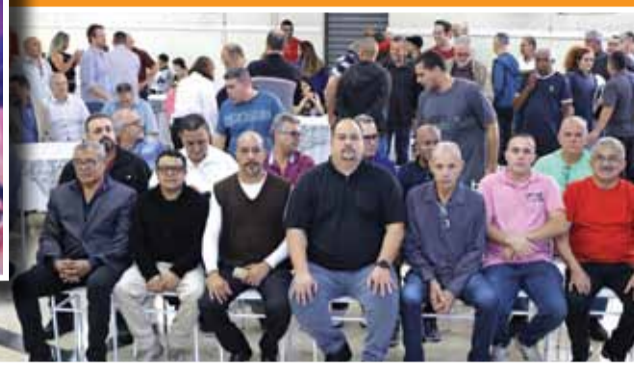
Diretoria do Sindicato acompanha cerimônia de posse

Após a apuração dos votos, o resultado foi anunciado pelo presidente da Federação dos Metalúrgicos do Estado de São Paulo, Eliseu Silva Costa. "Votos nulos, 01. Votos em branco, 24. Chapa 1, 1508 votos. Está eleita com 98,37% dos votos", para os aplausos e vibração da companheirada.