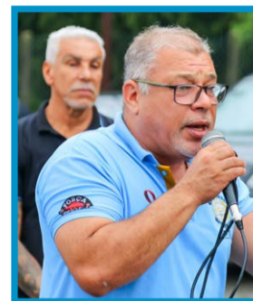
Sapão: “Esse resultado mostra a importância de ter um Sindicato forte.”

A medida foi bem recebida pelos trabalhadores e reforça a proposta de ampliar a participação da categoria nas decisões coletivas.