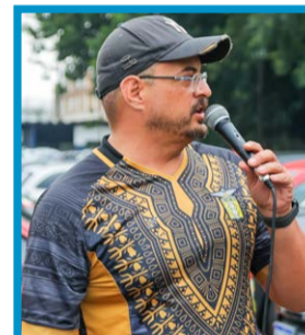
Loyola: “Atuação firme do Sindicato e uma participação importante da comissão.”