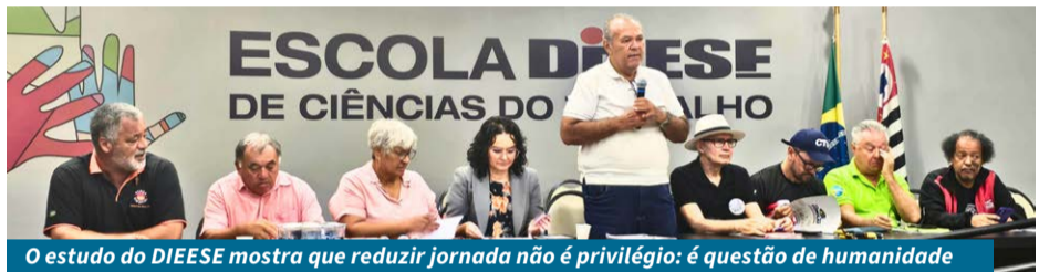
O estudo do DIEESE mostra que reduzir jornada não é privilégio: é questão de humanidade

Já o diretor Lincoln destacou o papel his-