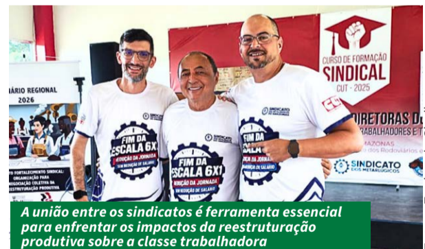
A união entre os sindicatos é ferramenta essencial para enfrentar os impactos da reestruturação produtiva sobre a classe trabalhadora

A atividade integra o Projeto Fortalecimento Sindical de Organização para Negociação Coletiva da Reestruturação Produtiva e conta com apoio da CUT, da CNTM e da IndustriALL Global Union, entidade internacional que atua na representação dos trabalhadores da indústria em diversos países.