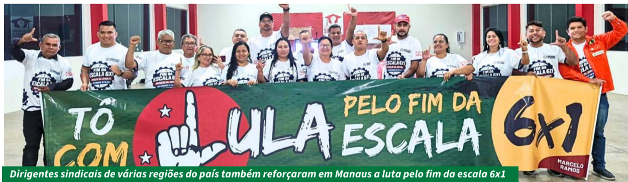
Dirigentes sindicais de várias regiões do país também reforçaram em Manaus a luta pelo fim da escala 6x1

Evento reuniu lideranças sindicais de todo o país para discutir reestruturação produtiva, negociação coletiva e os novos desafios da organização dos trabalhadores