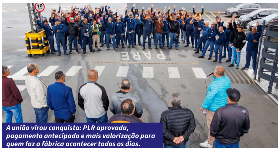
A união virou conquista: PLR aprovada, pagamento antecipado e mais valorização para quem faz a fábrica acontecer todos os dias.