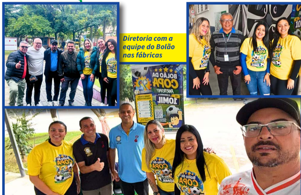
Diretoria com a equipe do Bolão nas fábricas

ninguém acerte exatamente o pódio, entram em cena os critérios alternativos, ou seja, acertar as três primeiras seleções. Persistindo sem vencedor, o Bolão segue vivo até o sorteio final, marcado para o dia 24 de julho, às 10h, quando serão sorteados dez prêmios de R$ 1 mil aos participantes.