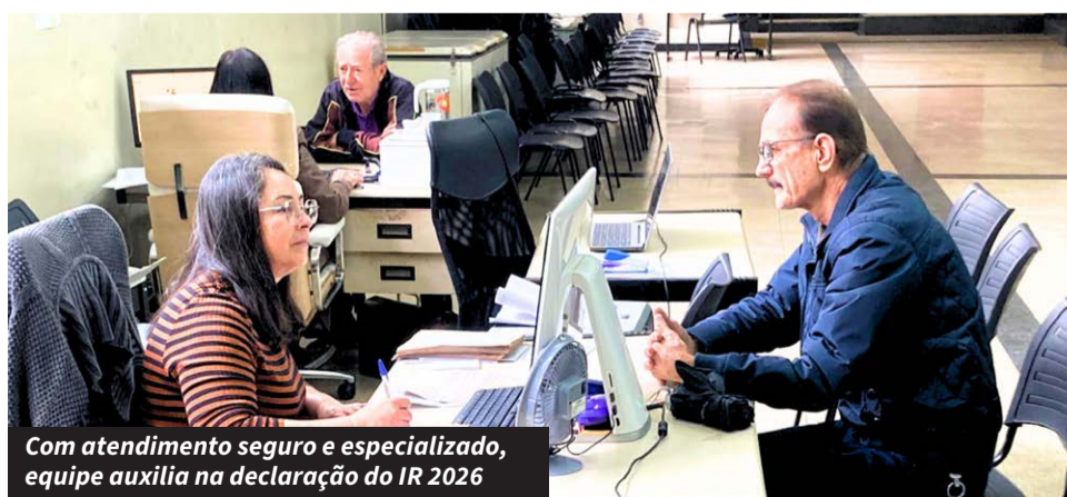
Com atendimento seguro e especializado, equipe auxilia na declaração do IR 2026

Para ajudar os trabalhadores da categoria, o Sindicato