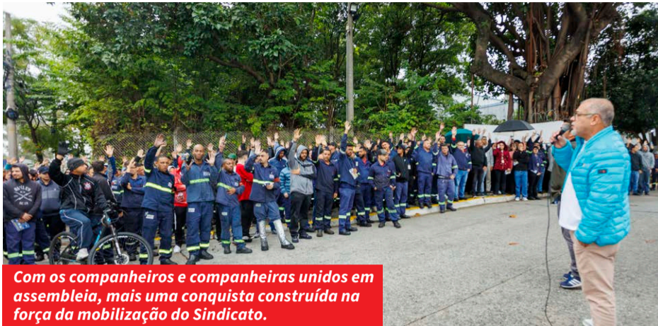
Com os companheiros e companheiras unidos em assembleia, mais uma conquista construída na força da mobilização do Sindicato.

Negociação do Sindicato com a empresa garante bonificação; metalúrgicos também aprovam proposta que amplia o Vale-Alimentação