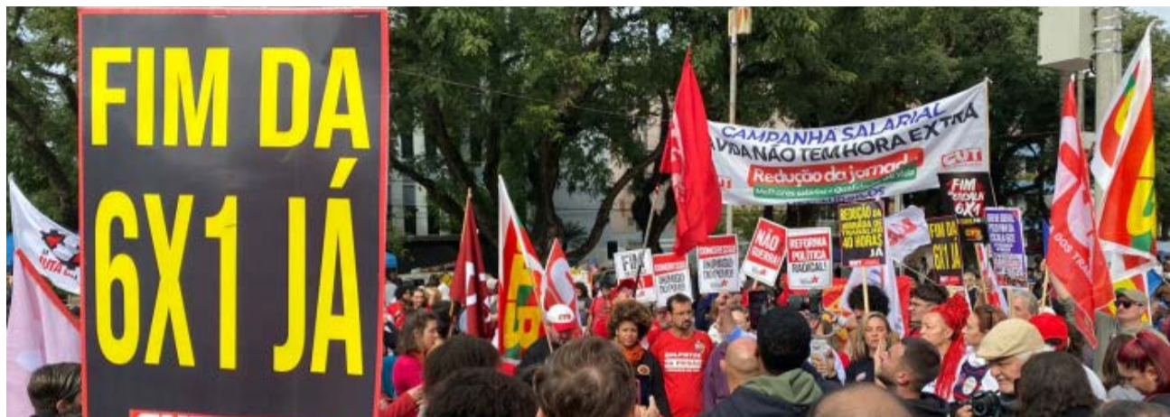
Entre cartazes, vozes e passos firmes, a classe trabalhadora manda um recado direto a Brasília: o fim da escala 6x1 é uma luta por tempo, saúde, dignidade e pelo direito de existir além do trabalho.

As centrais sindicais devem realizar, nos próximos dias, uma mobilização em Brasília para pressionar a comissão da Câmara Federal que irá analisar tanto o projeto encaminhado pelo governo federal quanto as propostas apresentadas pela deputada Erika Hilton (PSOL-SP) e pelo deputado Reginaldo Lopes (PT-MG), que tratam da redução da jornada de trabalho e do fim da escala 6x1. Até o fechamento desta edição, a definição era de que a votação acontecesse entre quarta-feira (27)